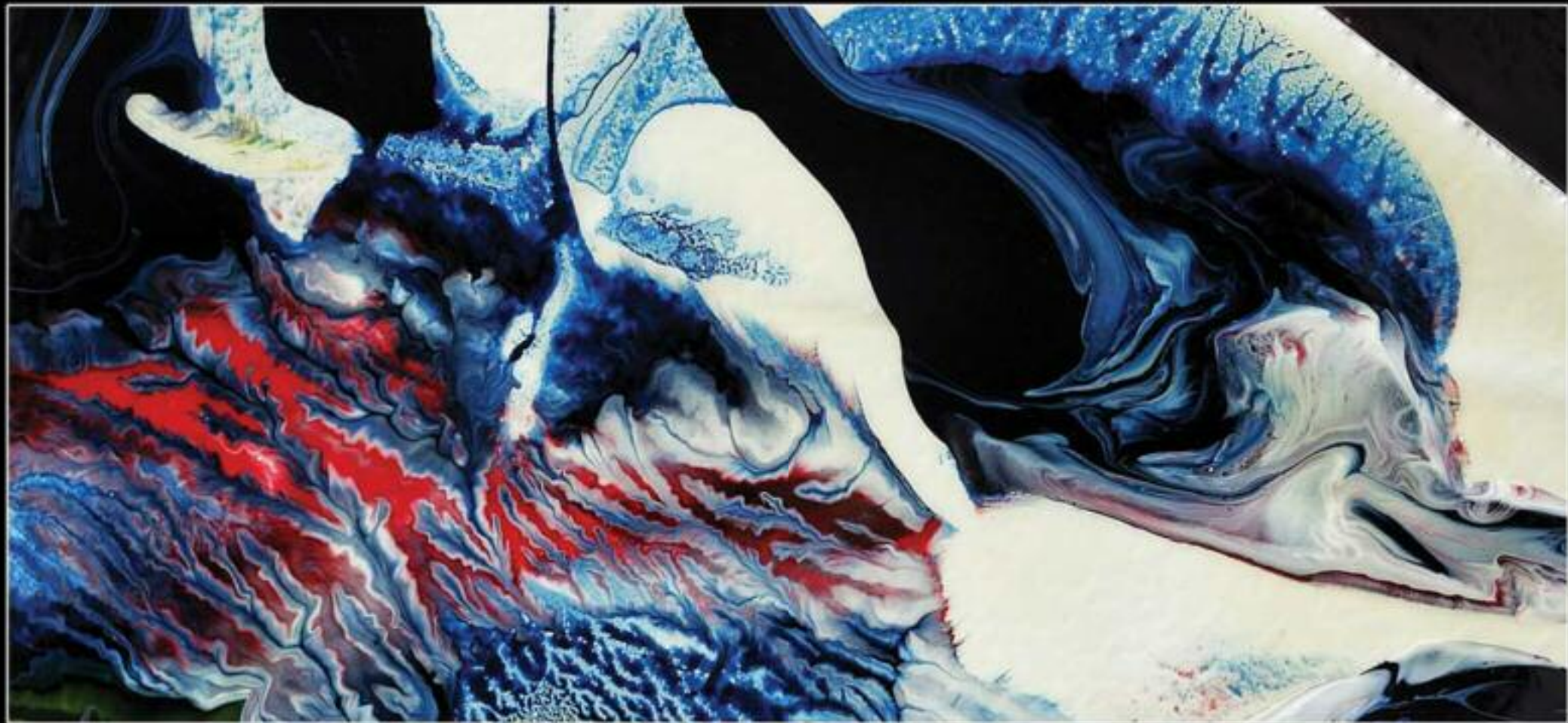
MARE D'INVERNO 130 X 90