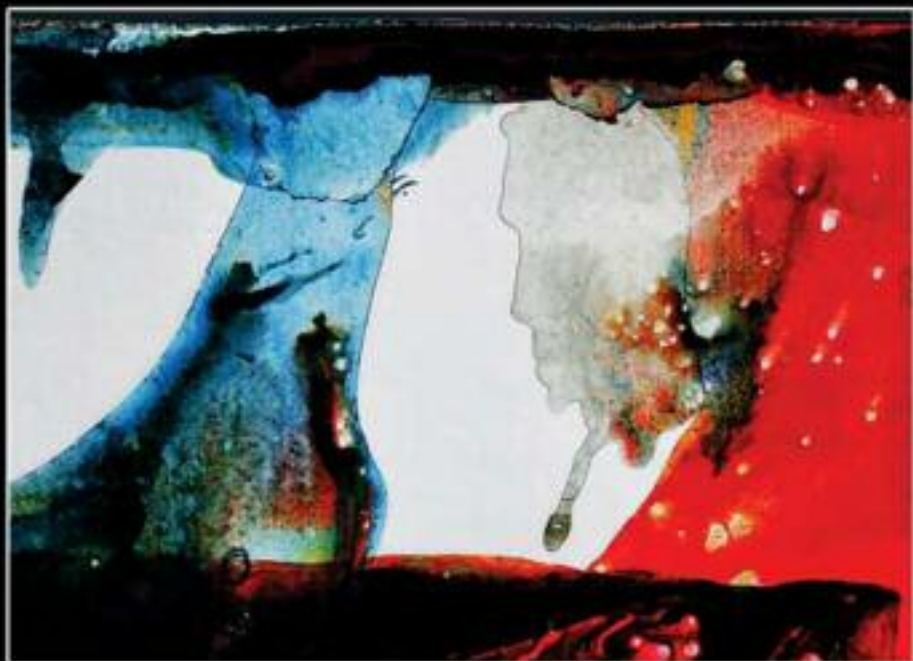
FANTASMI NELLA MIA MENTE 85 X 60