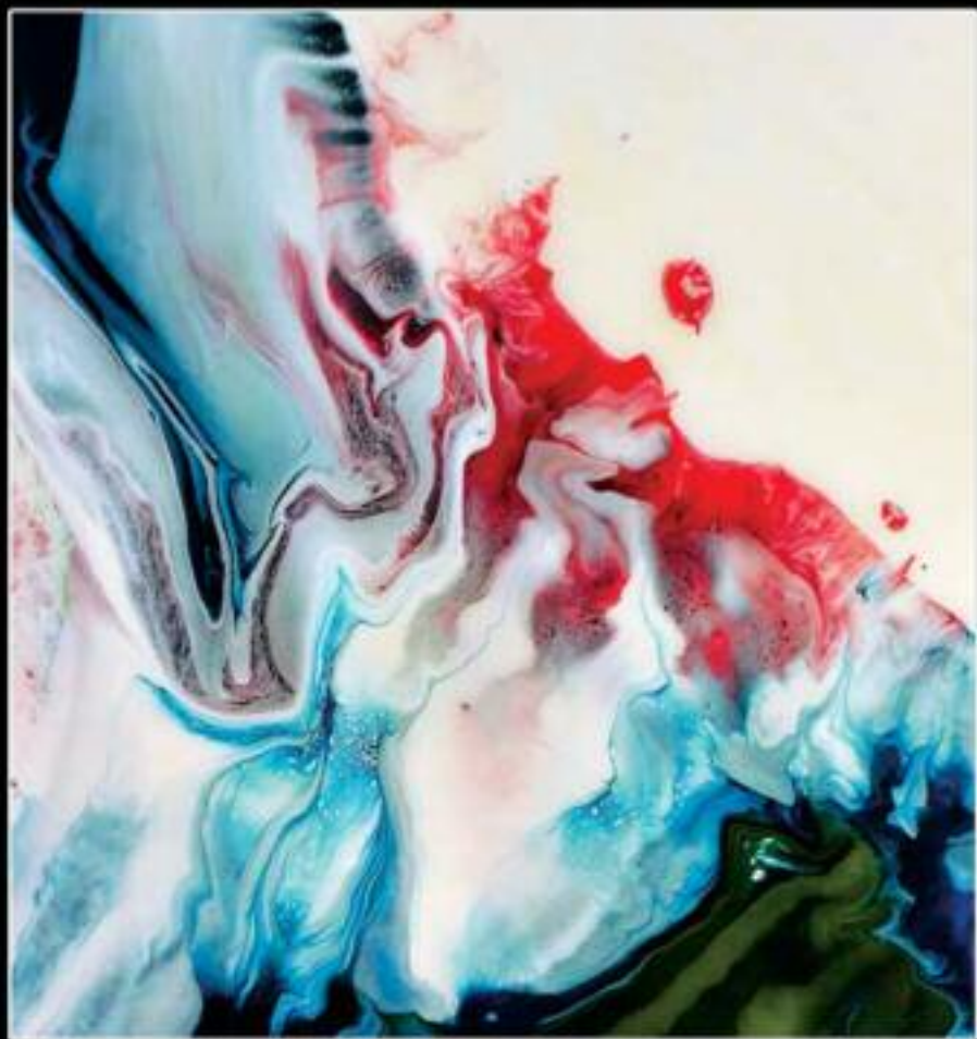
DISSOLVENZA 50 x 50