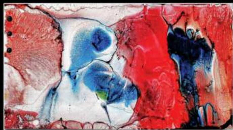
THE BIG ANGEL 31 X 19