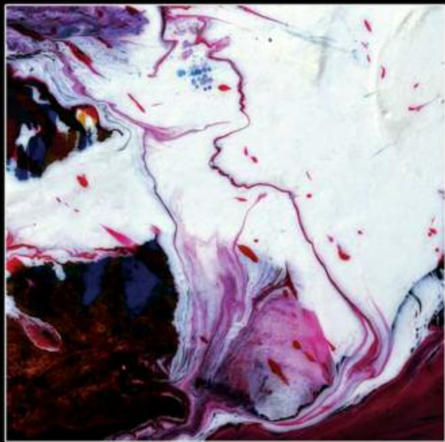
MISTERY 50 X 50