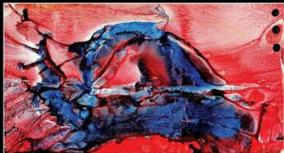
FORZA DELLA NATURA 31X19