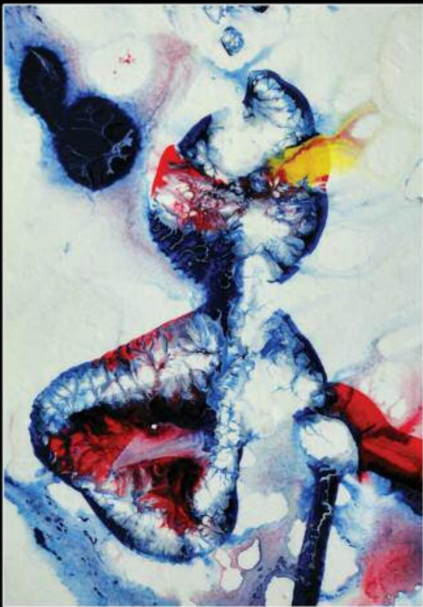
OCCHIO DI FUOCO 90 X 132