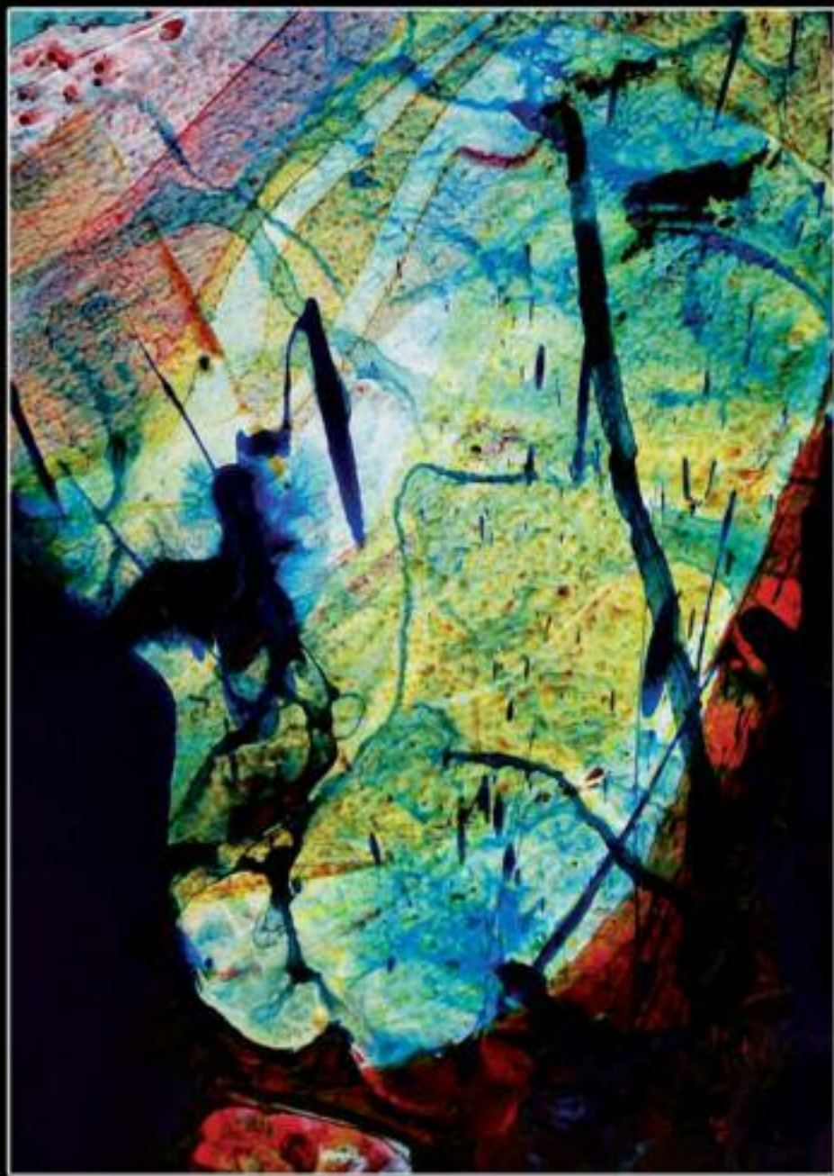
CAVALIERE SOLITARIO 70 x 100