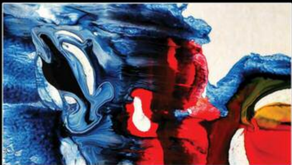
DELFINO 70 x 40