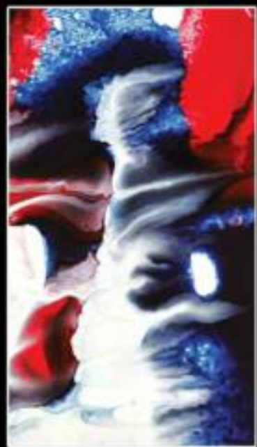
ANOTHER DAY 50 x 50