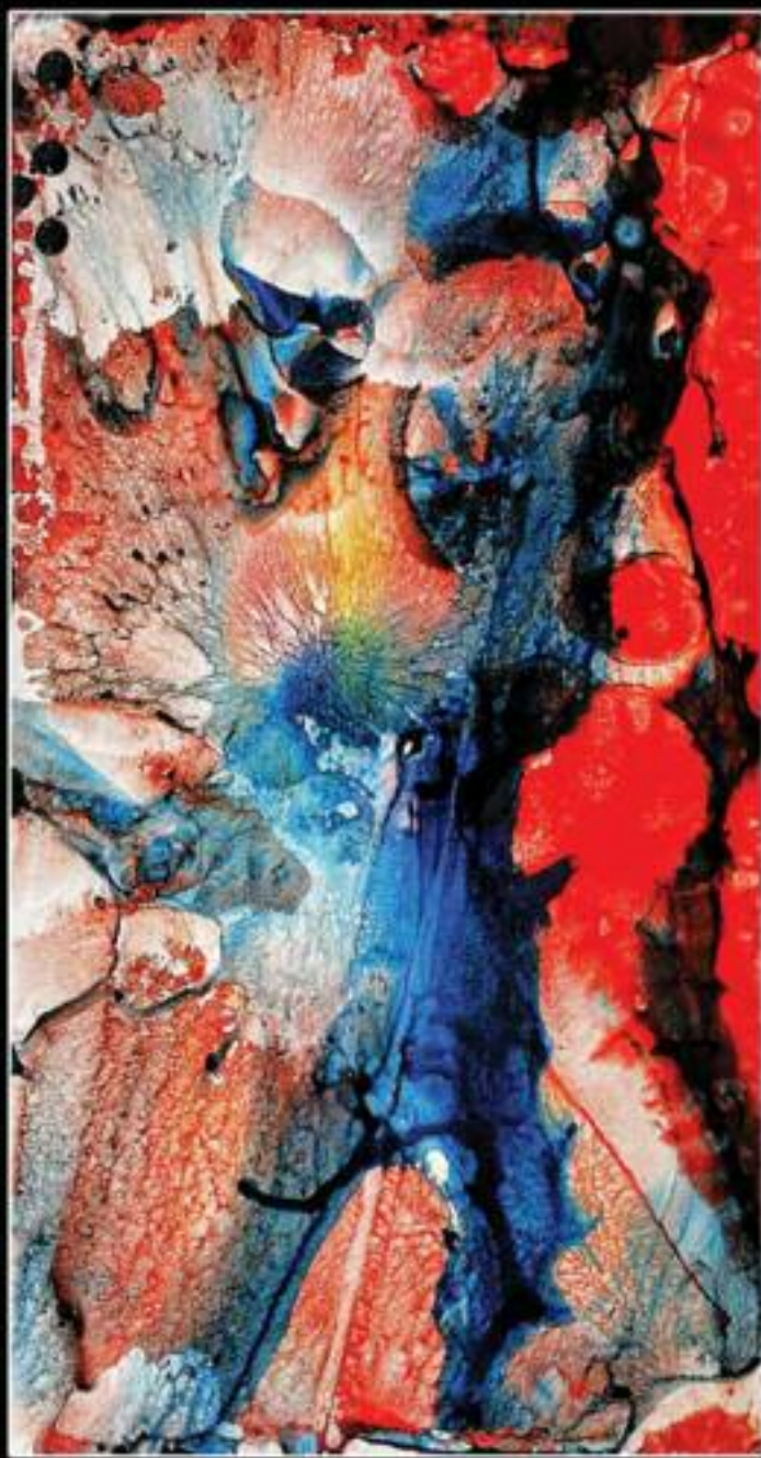
KING OF LIGHT 100 X 150