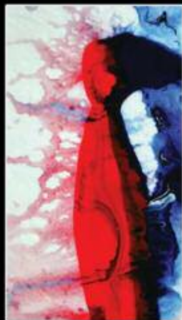
LIFE MUST GO ON 50 x 100