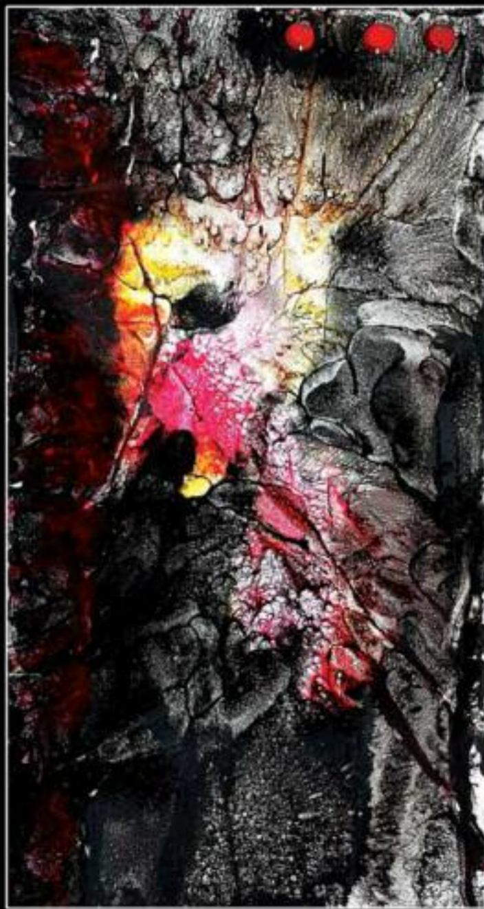
PORTATORE DI LUCE 19 x 31