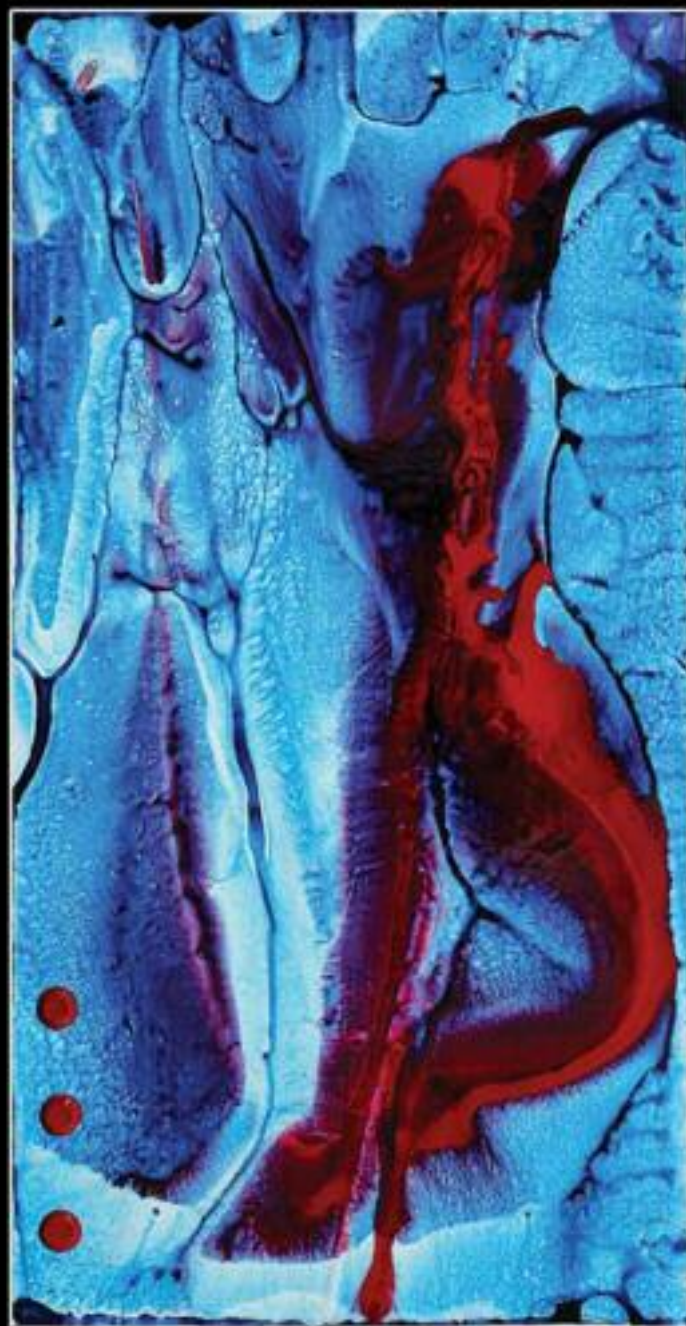
DIVINO 20 X 31