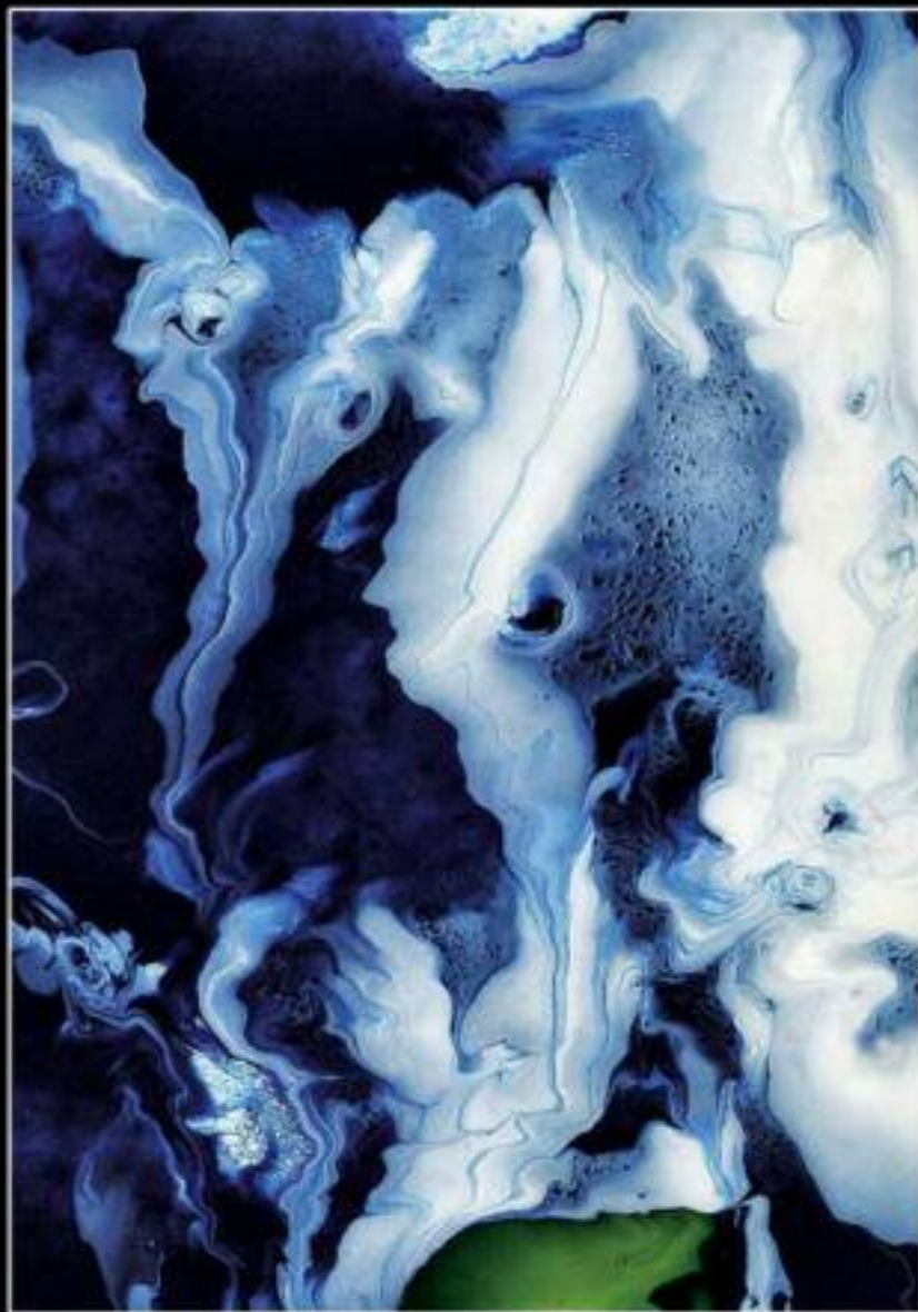
OCEANICA 30 X 45