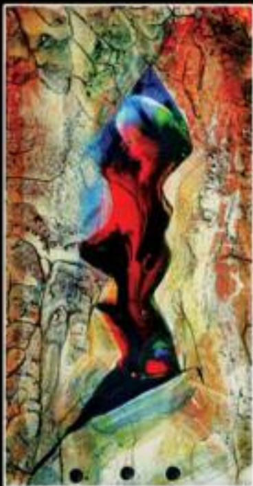
INSIDE 19 x 31