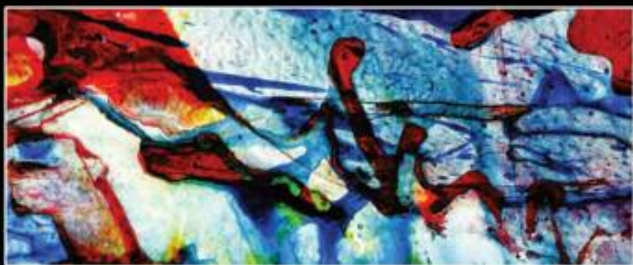
TIME AFTER TIME 100X40