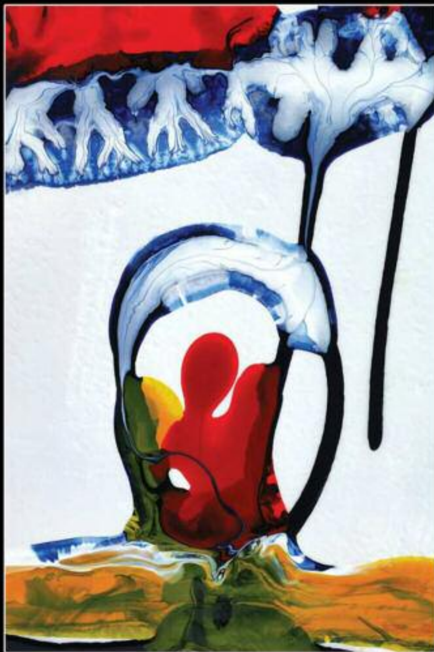
AMANTI 100 x 150